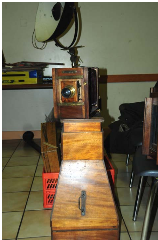
Une partie du matériel en vente.