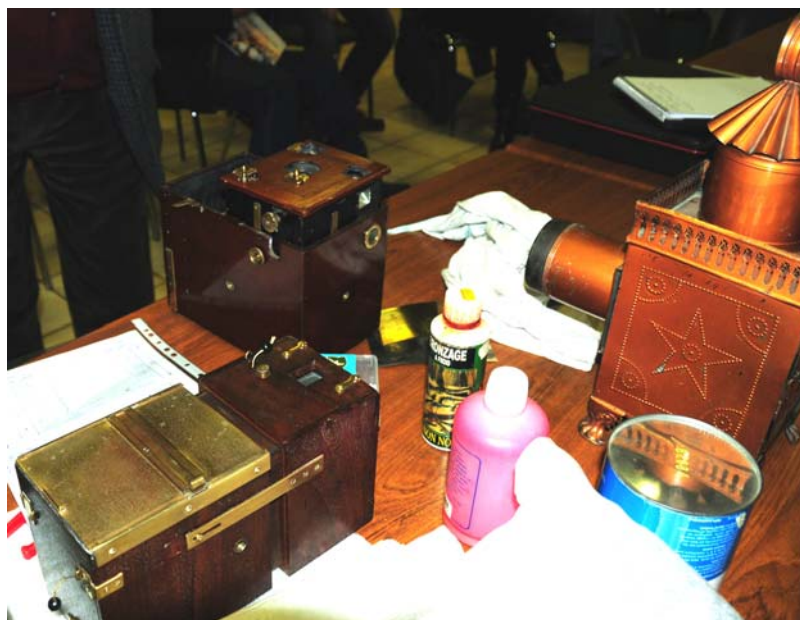
L'atelier de restauration. Alain en démonstration.