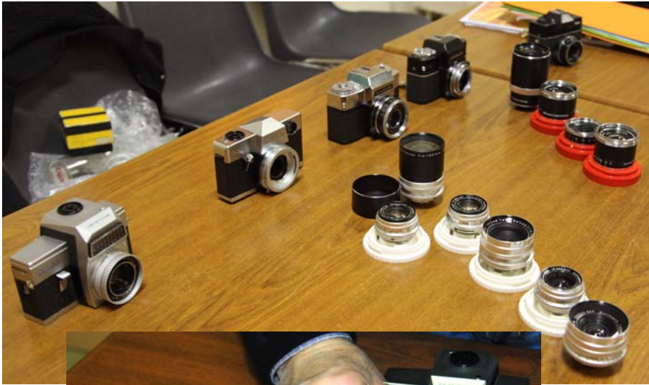
Présentation de quelques reflex 126.