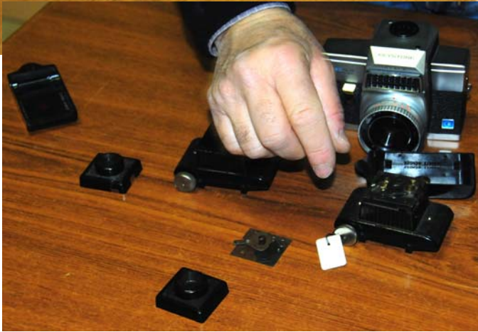
Deux modèles de Cadet démontés, qui font l'objet d'une page du Collectionneur dans DECLIC 46.