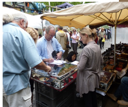
Madame Hoche se dévoue pour le musée