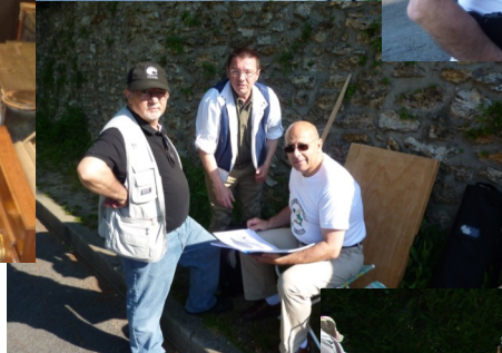
Les Déclic en consultations attireront de nombreux visiteurs.