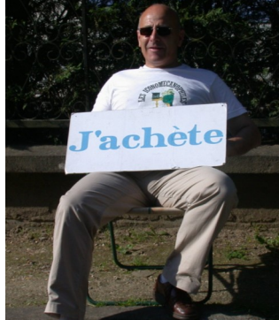
Oui mais je crains de n'être pas à l'heure de cette montre.