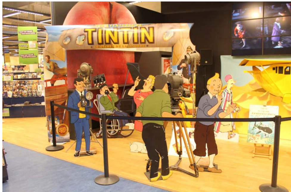
Info : Magasin Cultura à Limoges décoré par Gilles, du 24 février au 13 mars 2012.